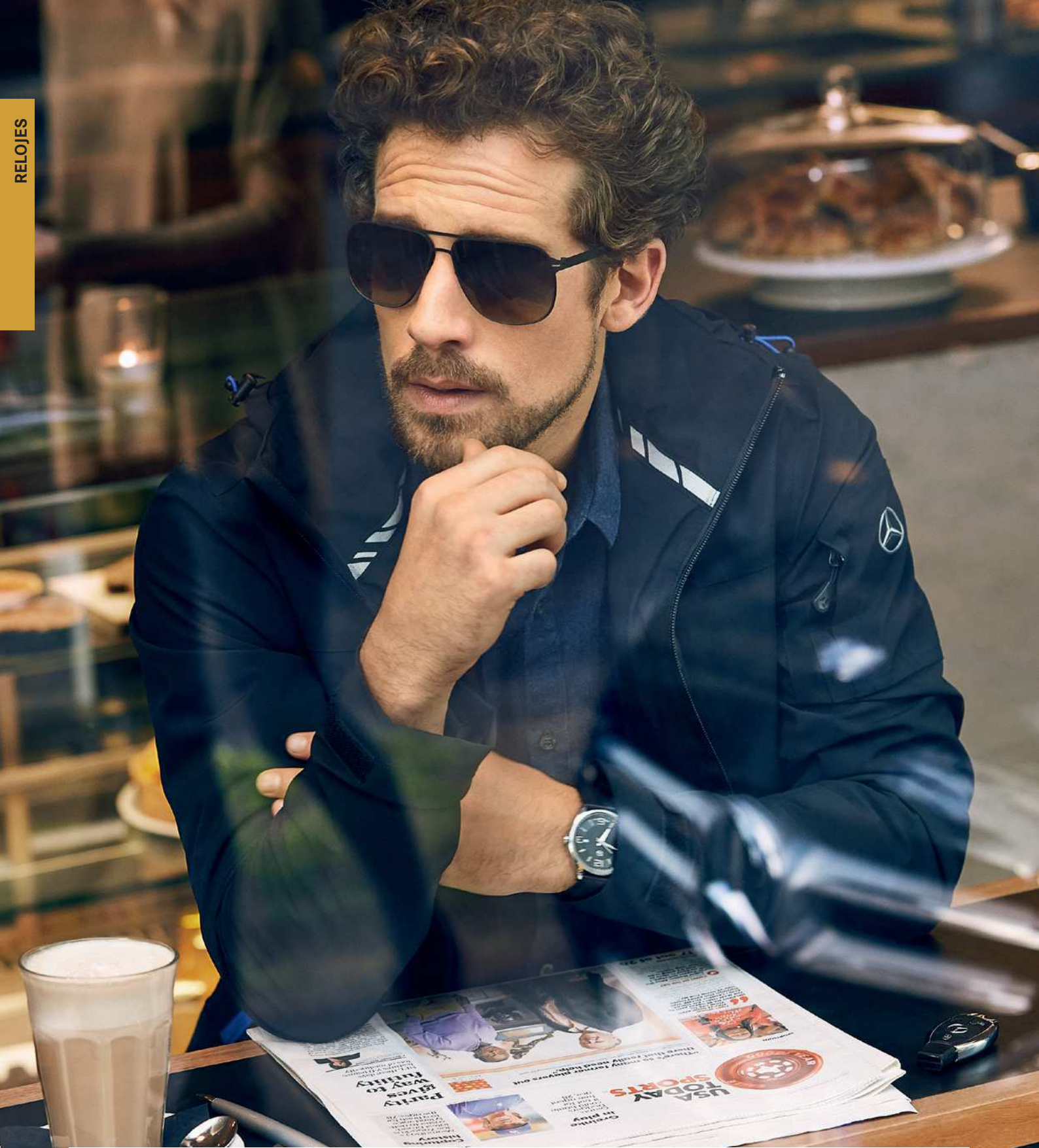
RELOJ DE PULSERA «ELEGANT BASIC», DE CABALLERO Página 33, CHAQUETA SOFTSHELL, CABALLERO Página 45, GAFAS DE SOL BLACK EDITION Página 66